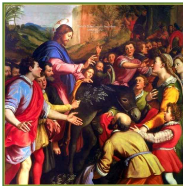
*사진 ①:예루살렘에 입성하신 예수님

성주간의 시작은 오늘! 오늘 전례였던 주님 수난 성지 주일이야. 이 사진 한번 볼래?